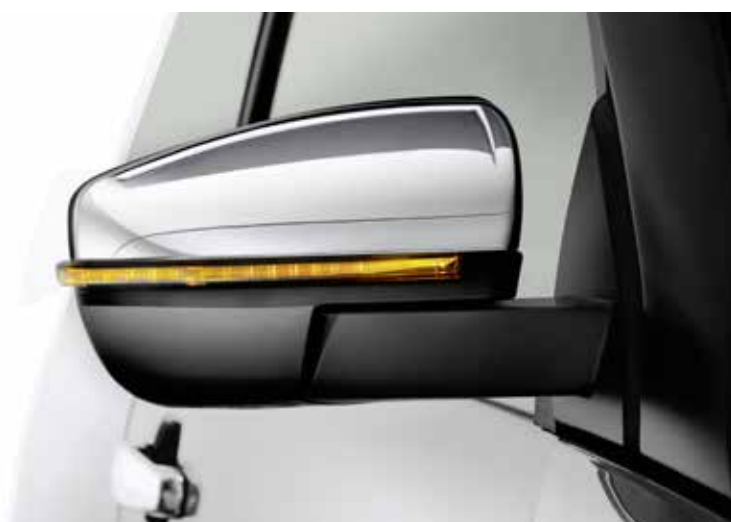
Aussenspiegel mit LED-Blinker, Serie ab Premium